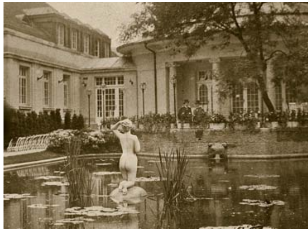
ANADYOMENE OP EEN SCHILDPAD IN WORDING, 1903 EN TIJDENS EEN TENTOONSTELLING IN BADEN-BADEN 1908

Een buitengewoon belangrijke opdracht voor de jonge beeldhouwer was in 1905 het vervaardigen van de twee enorme Jugendstilreliëfs die metaalarbeiders voorstellen aan de gevel van het nieuw te bouwen WMF kantoor in Berlijn. In 1904 - 05 liet de Württembergische Metallwaren Fabrik aan de Leipziger Straße, hoek Mauerstraße haar Berliner Haus bouwen. De architecten Ludwig Eisenlohr & Carl Weigle kozen voor een destijds heel modern ontwerp van een naar Amerikaans model uitgevoerd zakenpand, hetgeen zeer opvallend was in het toen nog nadrukkelijk classicistisch gebouwde Berliner Quartier. Het Jugendstilpand is na de val van de muur totaal gerenoveerd en gemoderniseerd met behoud van de reliëfs. Het is heden ten dage één van de weinige historische gebouwen aan de noordzijde van de Leipzigerstraße.