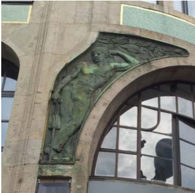
RELIËF VAN EPPLE AAN DE GEVEL VAN HET BERLINER HAUS WMF.