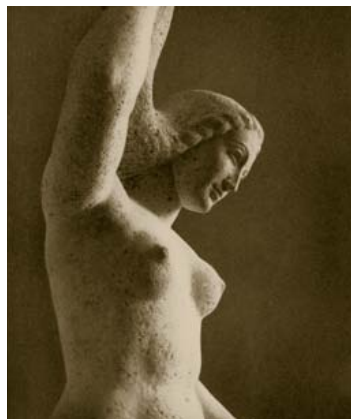
VAN LINKS NAAR RECHTS: MOEDER MET KINDEREN , 1931 (MÜNCHEN), DETAIL VAN BAADSTER IN HET FREIBAD MARIA-EINSIEDEL, 1933 (MÜNCHEN)