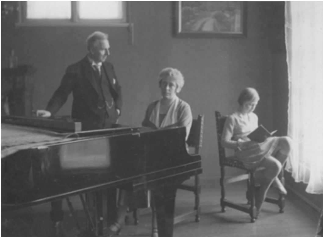
HET GEZIN EPPLE, CA. 1933