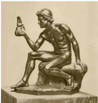
PROMETHEUS DIE DE MENS SCHEPT, 1910