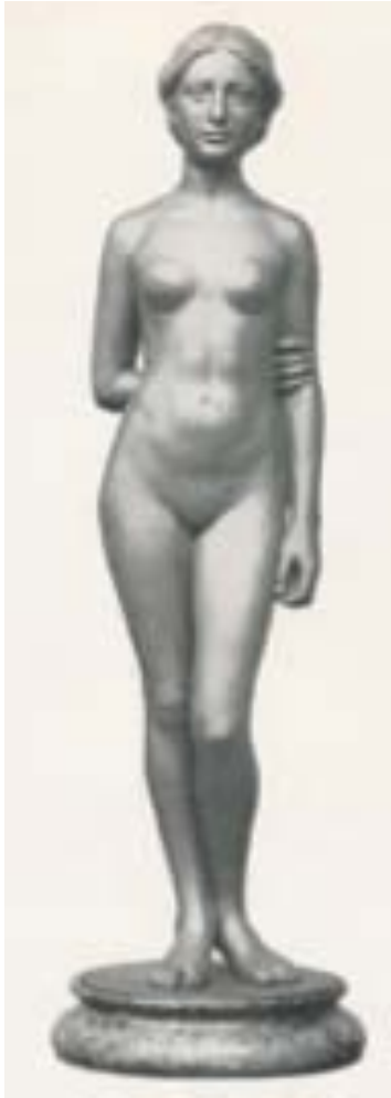
STEHENDES MÄDCHEN, 1902 (ROME), LATER DOOR WMF JUGEND GENOEMD.