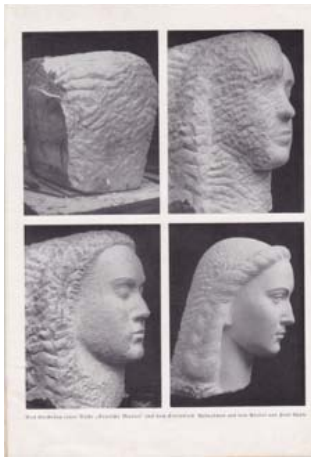
DEUTSCHE MUTTER ILLUSTRATIE BIJ VOM GESTALTEN IM STEIN (1936)

De kop van 'de Moeder' is zonder eenige pointillage geheel vrij uit het blok marmer gehouwen. Deze wijze van behandelen vereischt echter een bijzondere zelfbeheersing en een groot voorstellingsvermogen; het is voor mij echter de hoogste en meest verheffende kunst. 39