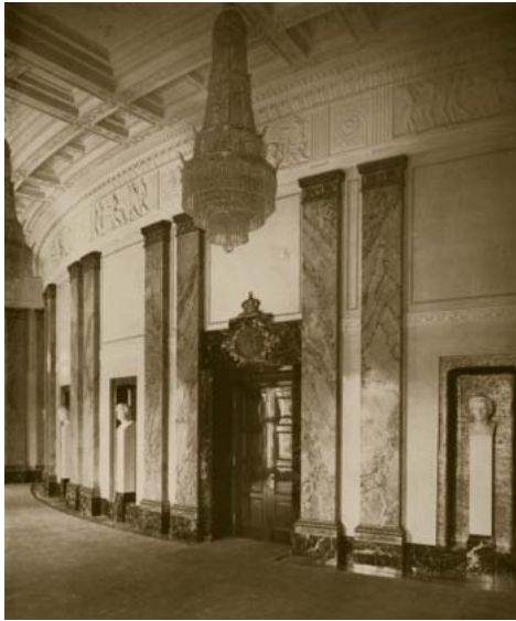
HET KÖNIGLICHEN HOFTHEATER TE STUTTART