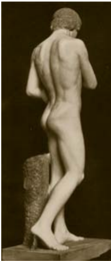
EPPLE, ORPHEUS , 1907, MARMER

was het werken vanuit de lijn en de contouren. De beeldhouwer diende een tekening te maken op het blok en aan de hand daarvan te hakken. Epple zou voortaan regelmatig 'en taille directe' werken, dus zonder voorafgaand model in een ander materiaal, direct in de steen of het marmer.