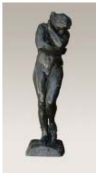
RODIN, EVA NA DE ZONDEVAL , 1881