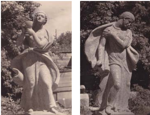
BERUSTING EN GELOOF, TWEE VAN DE VIER MEER DAN LEVENSGROTE BEELDEN VOOR DE GEVEL VAN HET ALTERSHEIM. DE VIER BEELDEN ZIJN DAAR NOG ALTIJD AANWEZIG.