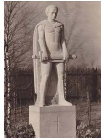
ONTHULLING VAN HET GEDENKTEKEN VAN DE LANDESPOLIZEI MÜNCHEN, 14-11-1931