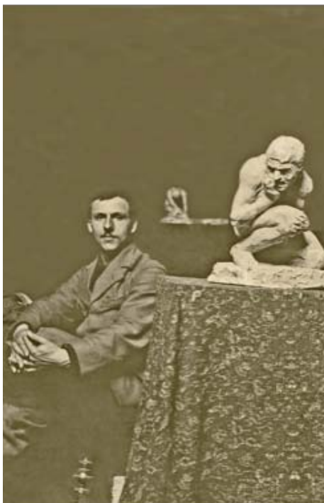
EMIL EPPLE MET BEELD KAÏN (MÜNCHEN 1898)

Over kunstenaars uit het interbellum zijn veel artikelen gepubliceerd, tentoonstellingen georganiseerd en kunstenaarsmonografieën geschreven. Vooral zij die expressionistische kenmerken bezaten of de abstracte kunst vertegenwoordigden, trokken en trekken nog altijd veel belangstelling bij onderzoekers en makers van exposities. Naast deze modernistische kunstenaars bestond er ook een grote groep zeer verdienstelijke figuratieve beeldhouwers, die met hun beeldhouwersvak doorgaans uitstekend de kost kon verdienen. Voor hen was tot voor kort in de kunsthistorische geschiedschrijving nauwelijks of geen belangstelling terwijl zij toch over het algemeen veel gevraagde opdrachtkunstenaars waren. Eén van deze beeldhouwers was de in Stuttgart geboren Emil Epple.