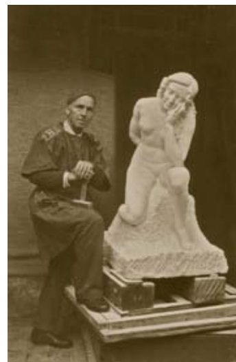
PEINZEND MEISJE, STUDIETEKENING, POSEERFOTO EN BIJNA VOLTOOID BEELD, 1947