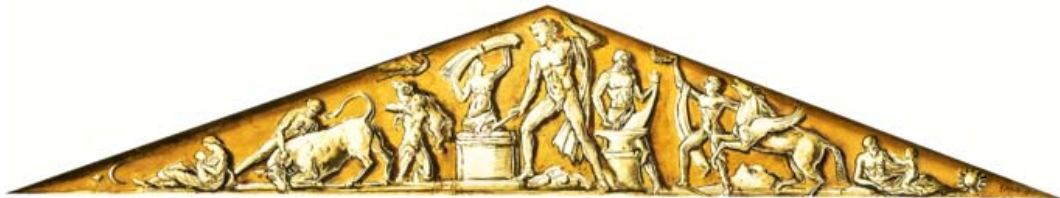
VREDE, 1940, ONTWERPTEKENING

Toen na de oorlog de naturalisatieaanvraag opnieuw in behandeling werd genomen, verklaarde Epple aan de hoofdcommissaris van politie: