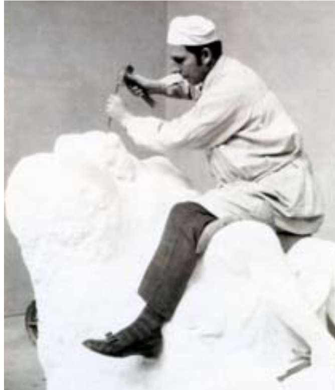
EPPLER WERKEND AAN DE SCHLAFENDE DIANA BESTEMD VOOR BARON VAN GEMMINGEN IN STUTTGART.

jaar de atelierwoning in de Ismaningerstraße huren van de beeldhouwer professor J. Echterler die net naar Mainz was verhuisd. Vermoedelijk was Epples financiële positie op dat moment verre van rooskleurig want Echterler moest zijn huurders nogal flink aanmanen om te betalen. Aan Groddeck, die twee keer een donatie deed van 100 DM, liet Epple in een dankbrief weten dat hij wat kleinere beelden zou maken die wellicht op te vatten zouden zijn als kitsch, maar met die verdienste wilde hij dan een groot werk bekostigen. Ook verkocht hij zijn beeld Jugend aan de Württemberger Metallwaren Fabrik in Geislingen. Het bedrijf kocht kunstwerken van beeldhouwers om in galvanoplastiek te verveelvoudigen, zo was ook het grote publiek in de gelegenheid om zijn huis op te sieren met 'kunst'. 11 Het vrouwenfiguurtje, aanvankelijk 'Stehendes Mädchen' genoemd stond in de WMF catalogus van 1910 met als grootste hoogte 83 cm en met marmersokkel voor de prijs van 225 DM. 12